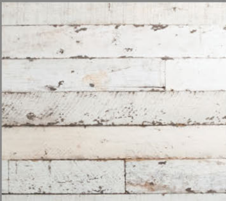
フェンスウッド ホワイトペイント

樹種 オーク・ヒッコリー・ポプラなど 寸法 13mm×102/127mm×乱尺 形状 実なし