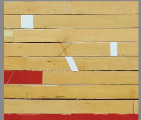
ジムフローリング