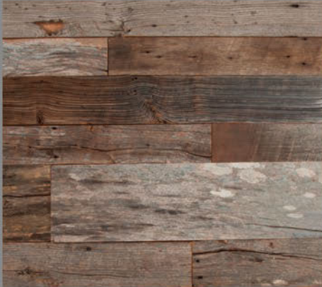
バーンウッド グレー&ブラウン

樹種 オーク・ビーチ・パイン・ヘムロックなど 寸法 15~30mm×乱幅×乱尺 乱幅 102/127/152/178/203mm 形状 実なし