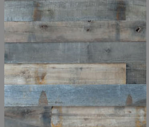
レールヤードパティナー オーク

樹種 オーク・ヒッコリー・ポプラなど 寸法 13mm×102/127mm×乱尺 形状 実なし