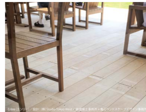
Enlee (エンリー) / 設計: (株) Studio Tokyo West + 建築士事務所 + 亀山ランドスケープデザイン事務所