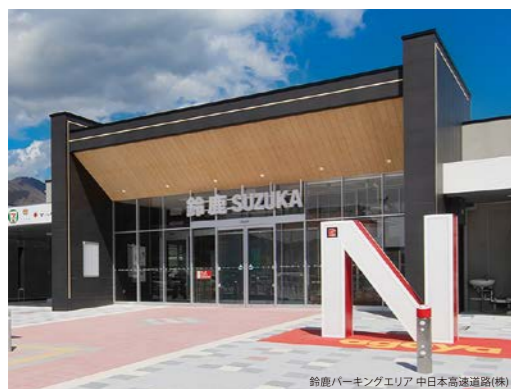
鈴鹿パーキングエリア 中日本高速道路(株)