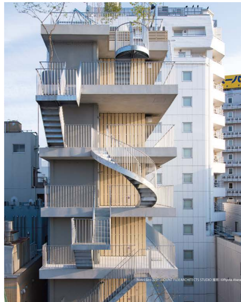
hotel Siro 設計: MOUNT FUJI ARCHITECTS STUDIO

*デッキ床材(ASP・ADS)は1面にブラウステインが色濃く残る場合があります。 角材(AHQ)は2面以上にブラウステインが色濃く残る場合があります。また、下地材としてご用意しているため、製材品の質感が残る場合があります。