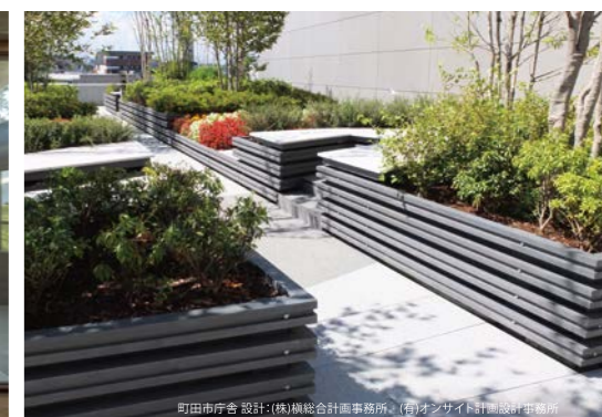
町田市庁舎 設計: (株)横総設計事務所 (有)オンサイト計画設計事務所