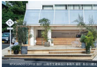
KITASANDO COFFEE 設計: 山路哲生建築設計事務所