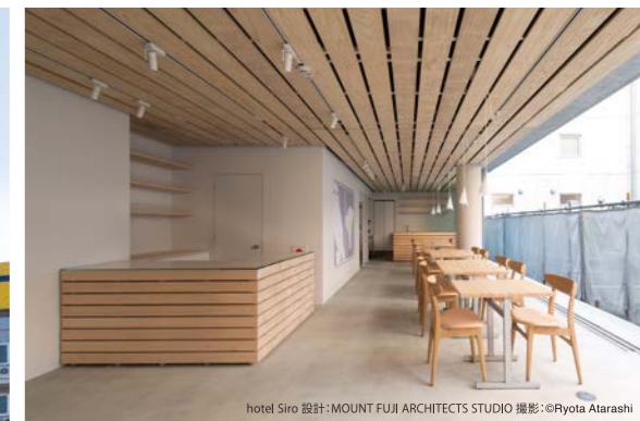
hotel Siro 設計: MOUNT FUJI ARCHITECTS STUDIO