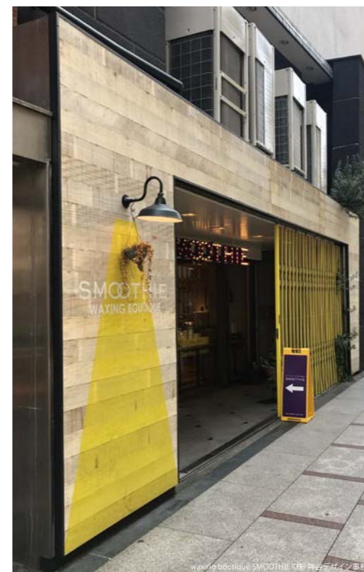
waxing boutique SMOOTHIE 株式会社デザイン事務所

*厚みにバラツキがあります。表面には、色むら、杣木跡、毛羽立ち、割れ、節、チョークマークや印字などがあります。