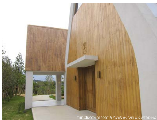
THE GINOZA RESORT 美らの教会 / ARLUIS WEDDING