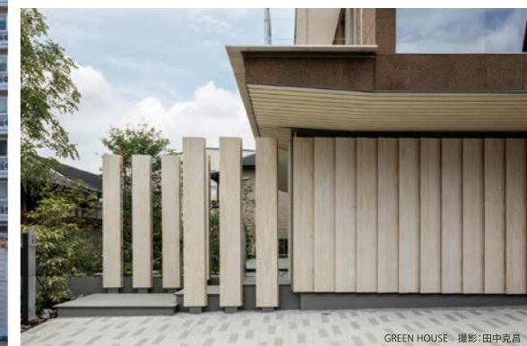
GREEN HOUSE