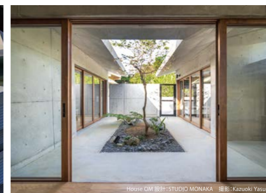
House OM 設計: STUDIO MONAKA