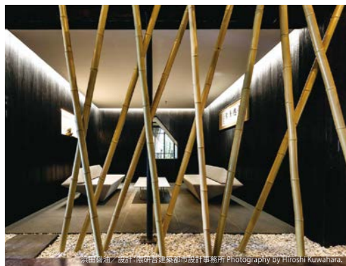
浜田謙治 / 設計: 隈研吾建築都市設計事務所