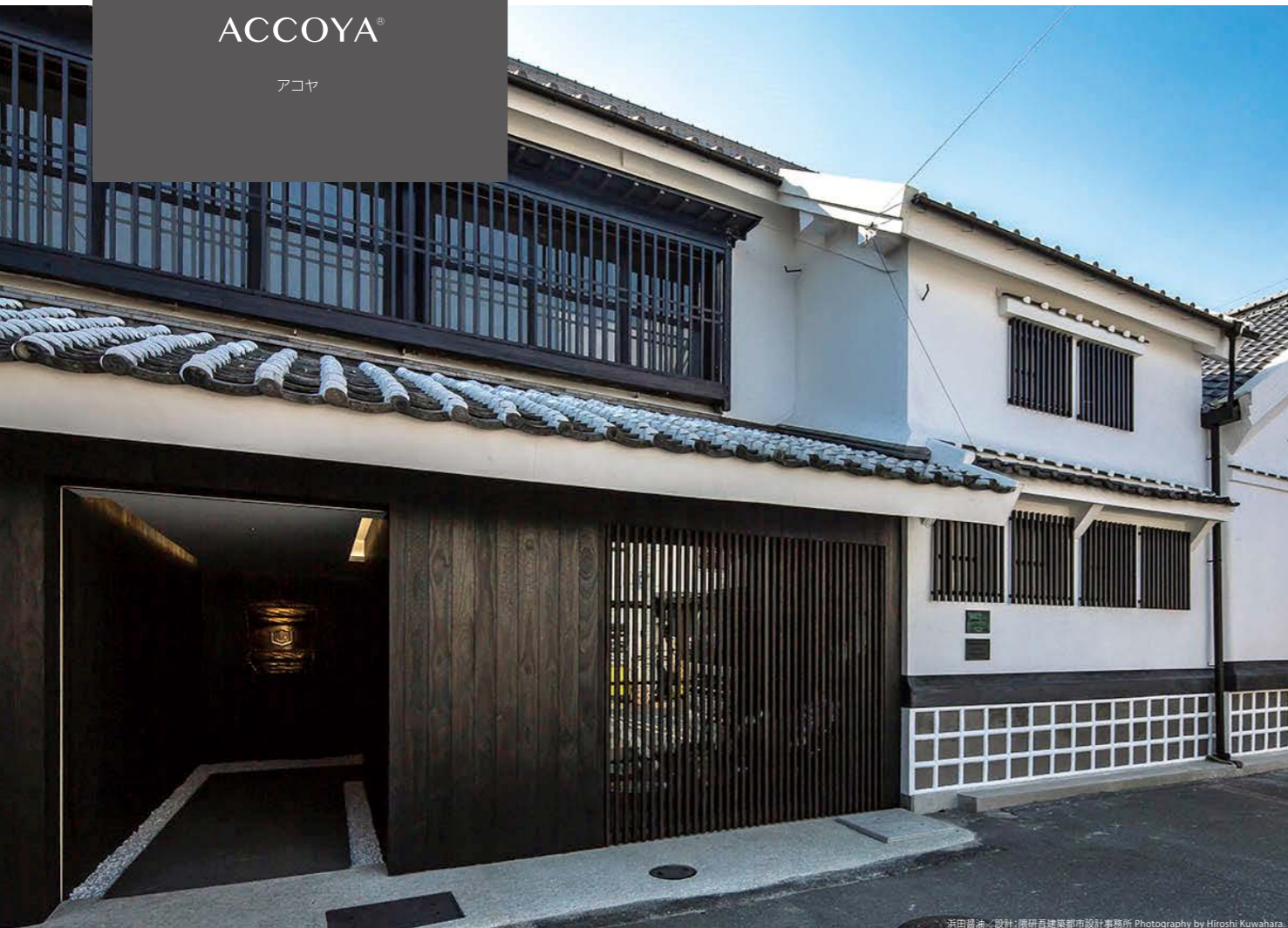
浜田謙治 / 設計: 隈研吾建築都市設計事務所 Photography by Hiroshi Kuwahara.