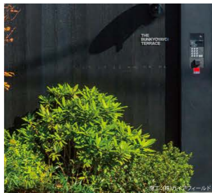
宮工(株)木カウビルド