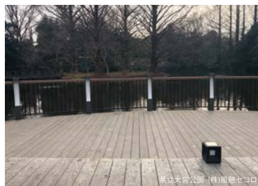
東立木造公園 (株) 風船セコロ