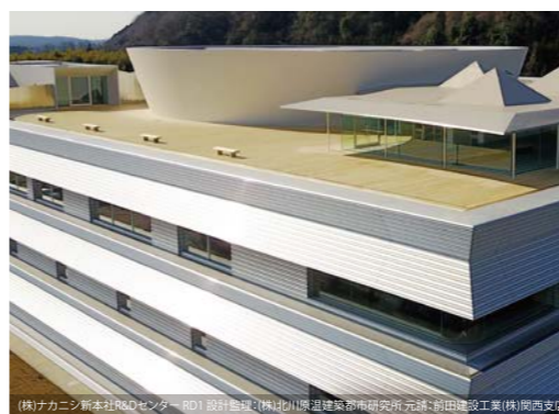
(株)ナカニシ新本社R&Dセンター 設計監理: (株)北川原建築都市研究所 元請: 前田建設工業(株)関西支店