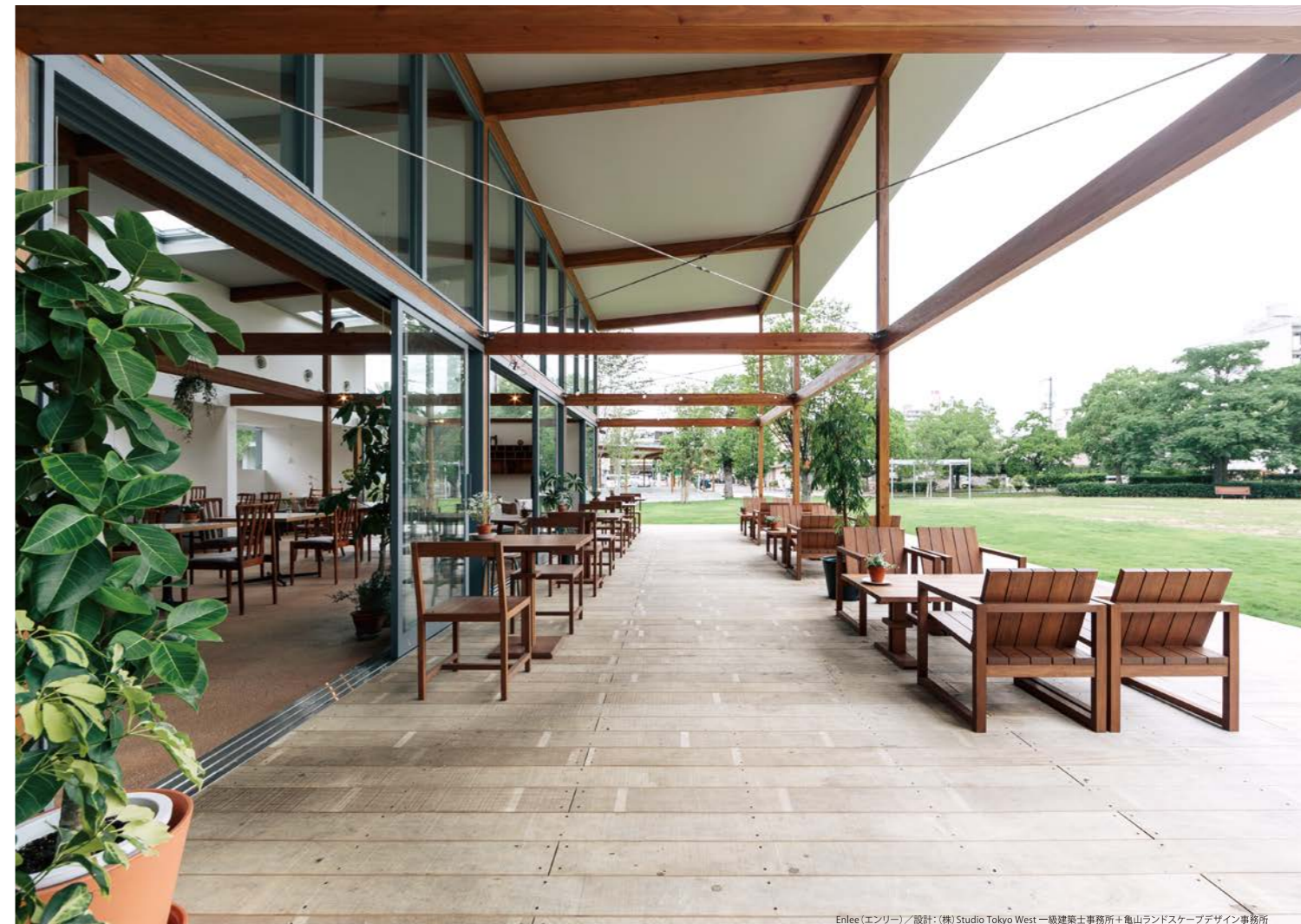
Enlee (エンリー) / 設計: (株) Studio Tokyo West 一級建築士事務所 + 亀山ランドスケープデザイン事務所