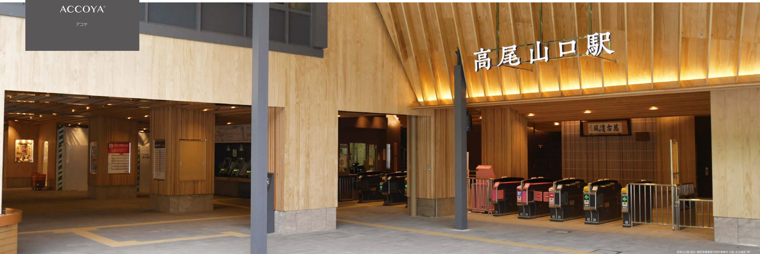
高尾山口駅 設計: 隈研吾建築都市設計事務所 元請: 京王建設 (株)