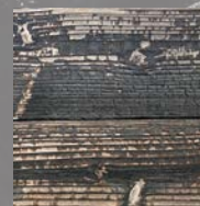
通常の焼杉(無塗装)