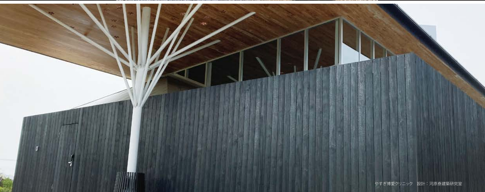
やすぎ博愛クリニック 設計：河原泰建築研究室