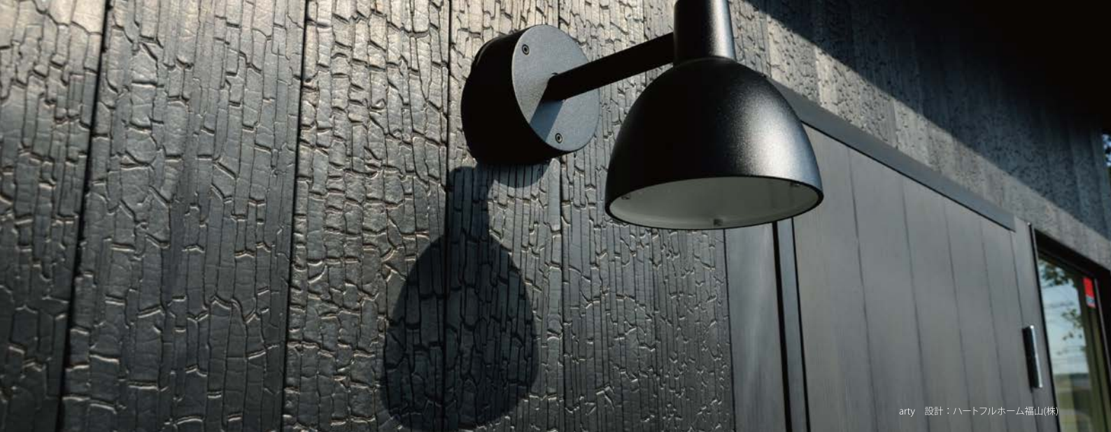
arty 設計：ハートフルホーム福山(株)