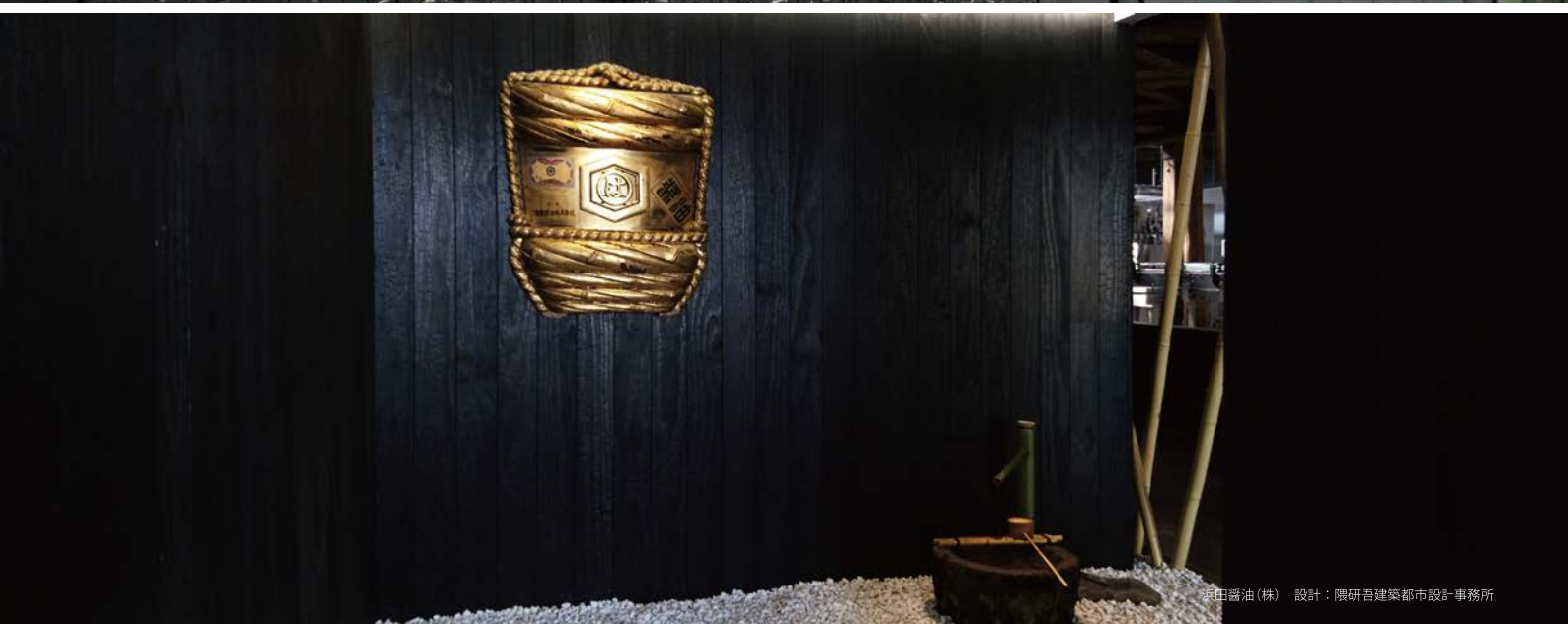
原田醤油(株) 設計：隈研吾建築都市設計事務所